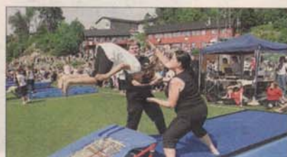
SALTO: Det var stor stas da 10-12-åringene fikk hoppe på trampett, og de fleste valgte å ta salto.