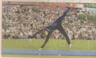
FULLT PÅ TRIBUNEN: En rekke stolte foreldre og slektninger hadde tatt turen til Lilandsbanen.