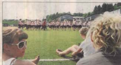
STOR TROPP: Gressmatten på Lilandsbanen var nesten full da de store fellestroppene var i aksjon.