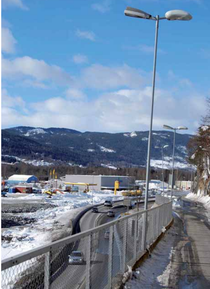
IKKE ANSVARLIGE: Notodden Energi er ikke ansvarlige for gatelysene langs E 134.

Vi har imidlertid en løpende avtale med kommunen om vedlikehold