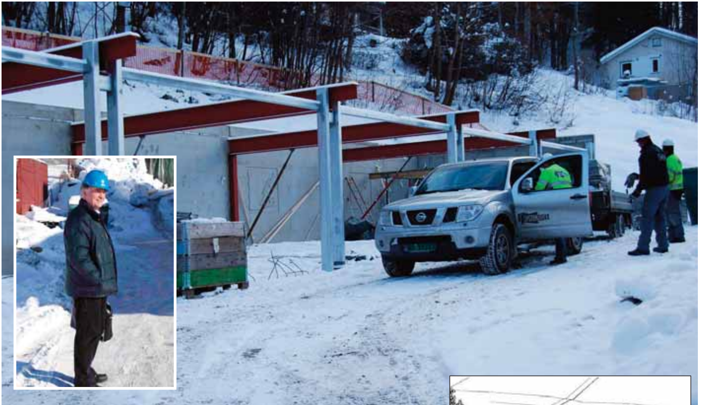
GARASJEBYGG: Om kort tid vil et nytt garasjebygg stå klart i Lienveien 39. Johannes Skinnarland (innfelt) er leid inn som konsulent fra NE sin side i forbindelse med byggearbeidene.